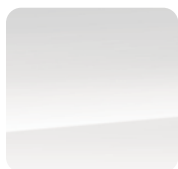
5JQ Bright White