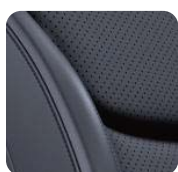
1DL Skóra Nappa Czarna