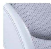
XSJ Skóra Nappa Szara