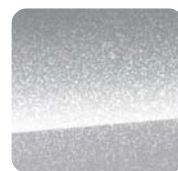
5CH Billet Silver Metaliczny