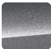
210 Granite Crystal Metaliczny