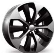
WSX Aluminowe felgi 19"x7,5" polerowane