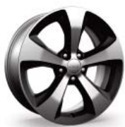
WPR Aluminowe felgi 18"x7,0" polerowane